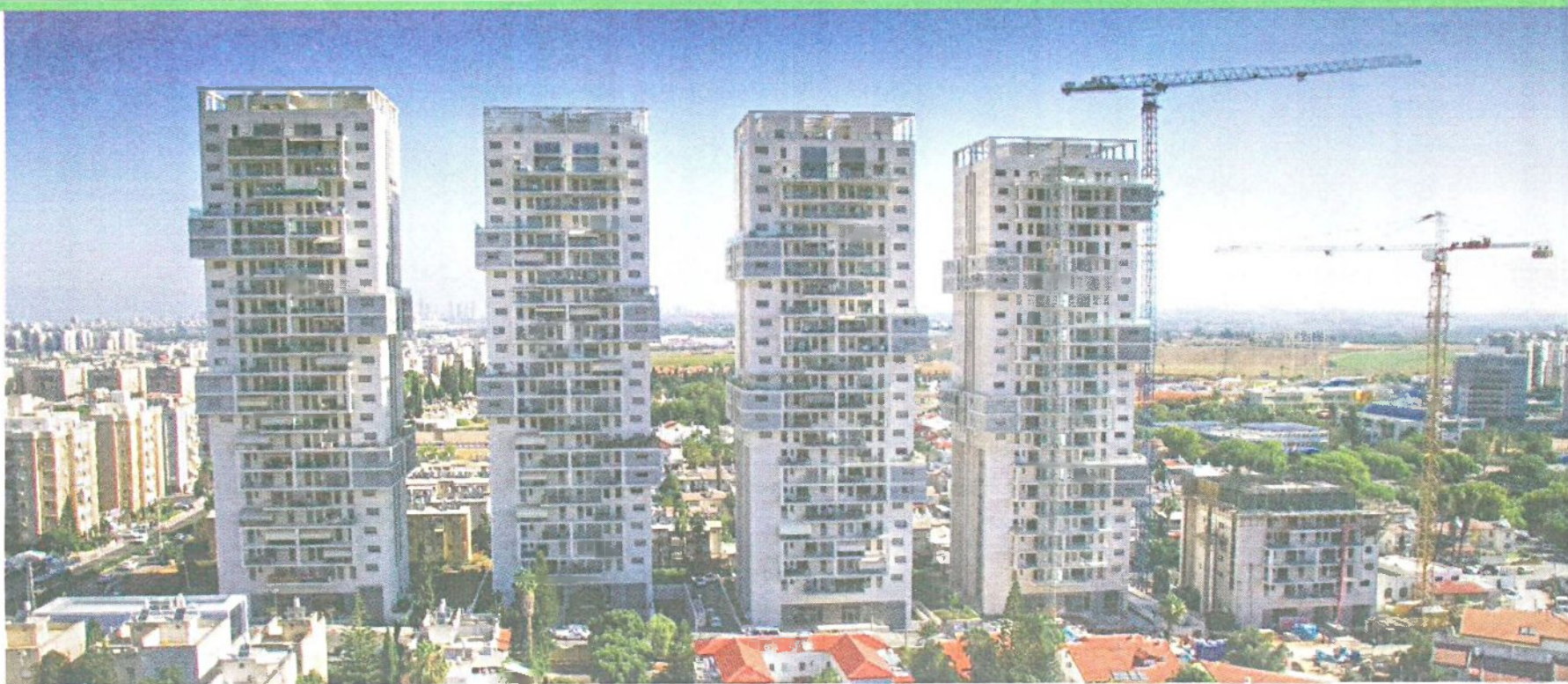
פרויקט דוניץ בקריית האמנים של חברת אחים דוניץ